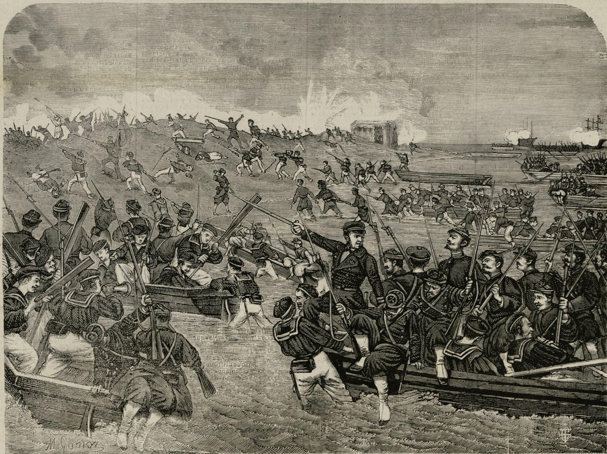
DESEMBARCO DE LOS FRANCESES EN SFAX.

Los primeros se van; los segundos se quedan