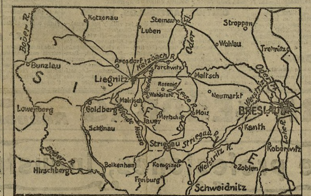
Croquis del campo de maniobras

El ejército alemán, dividido en bando azul y bando rojo, ha verificado unas grandiosas maniobras militares, haciendo aplicación de todos los últimos inventos y dejando admirados a los técnicos extranjeros