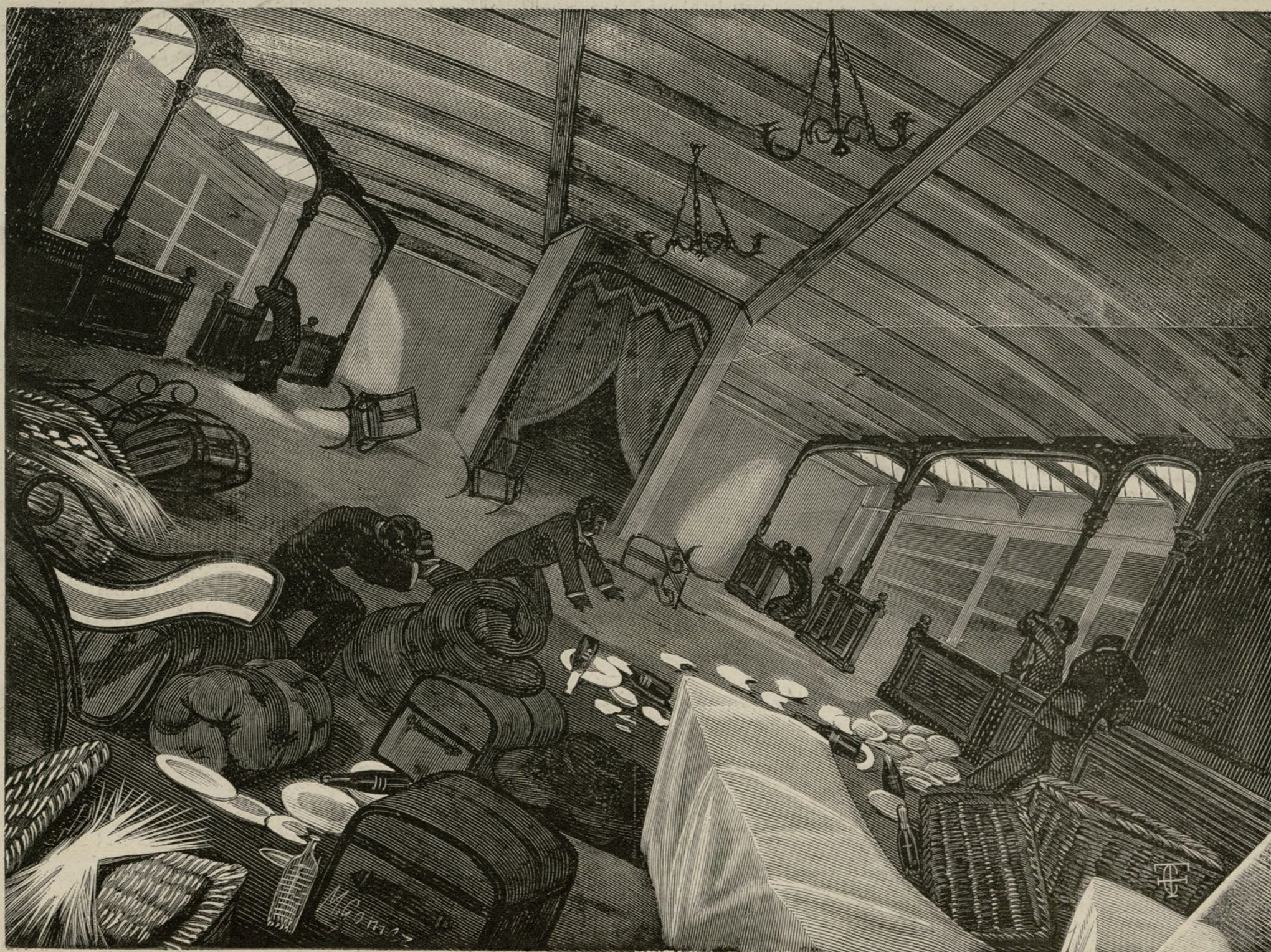
EL COMEDOR DE UN BUQUE EN UNA TEMPESTAD. Ayuntamiento de Madrid