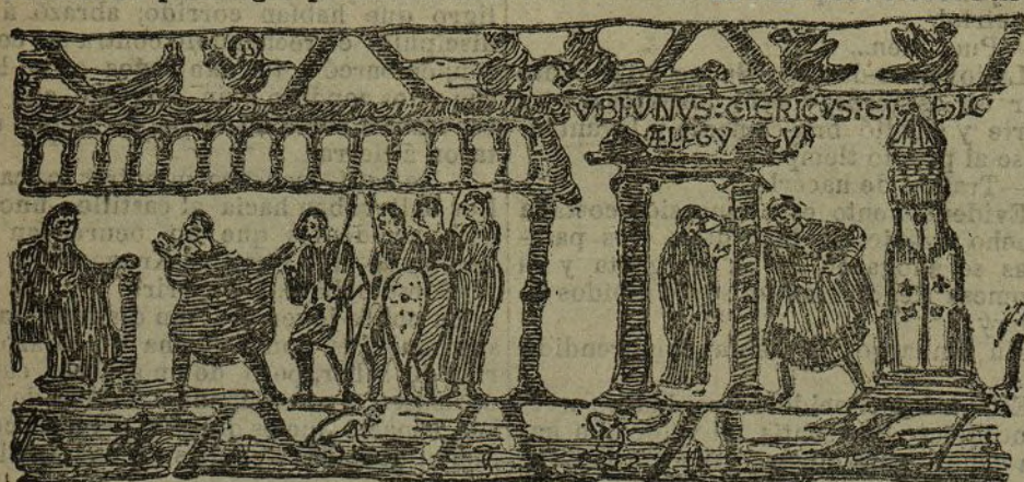
Otro fragmento del tapiz de la reina Matilde