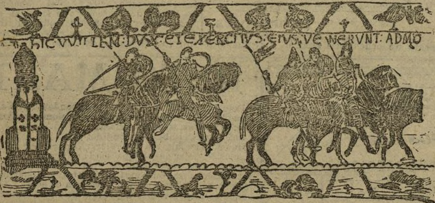
El tapiz de la reina Matilde (fragmento)

Bayeux, vieja villa, que en la verde llanura normanda está dormida a la sombra de su catedral. Esta catedral, gótica, es sede episcopal, y el eco a liturgia y el aroma a incienso que de ella trasciende, diríase que aumentan la quietud de la vida callada en las plazas con árboles, en las calles sin ruido, en los patios de jardines y posadas, donde se descomentan carros y coches de esos que parecen condenados a no echar a andar nunca. Claro que un automóvil rompe a cada instante el silencio; pero sin quebrar la quietud, porque estas máquinas de vértigo tienen el privilegio de correr sin inquietud y levantar su ruido sin deshacer la paz de los valles y aldeas por donde van pasando; tal corren las estrellas en Agosto sin deshacer la paz de la noche.