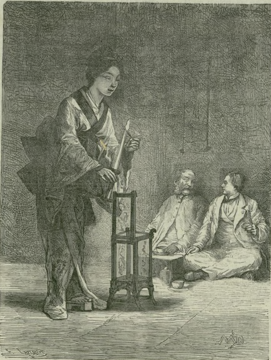
UNA JÓVEN JAPONESA.