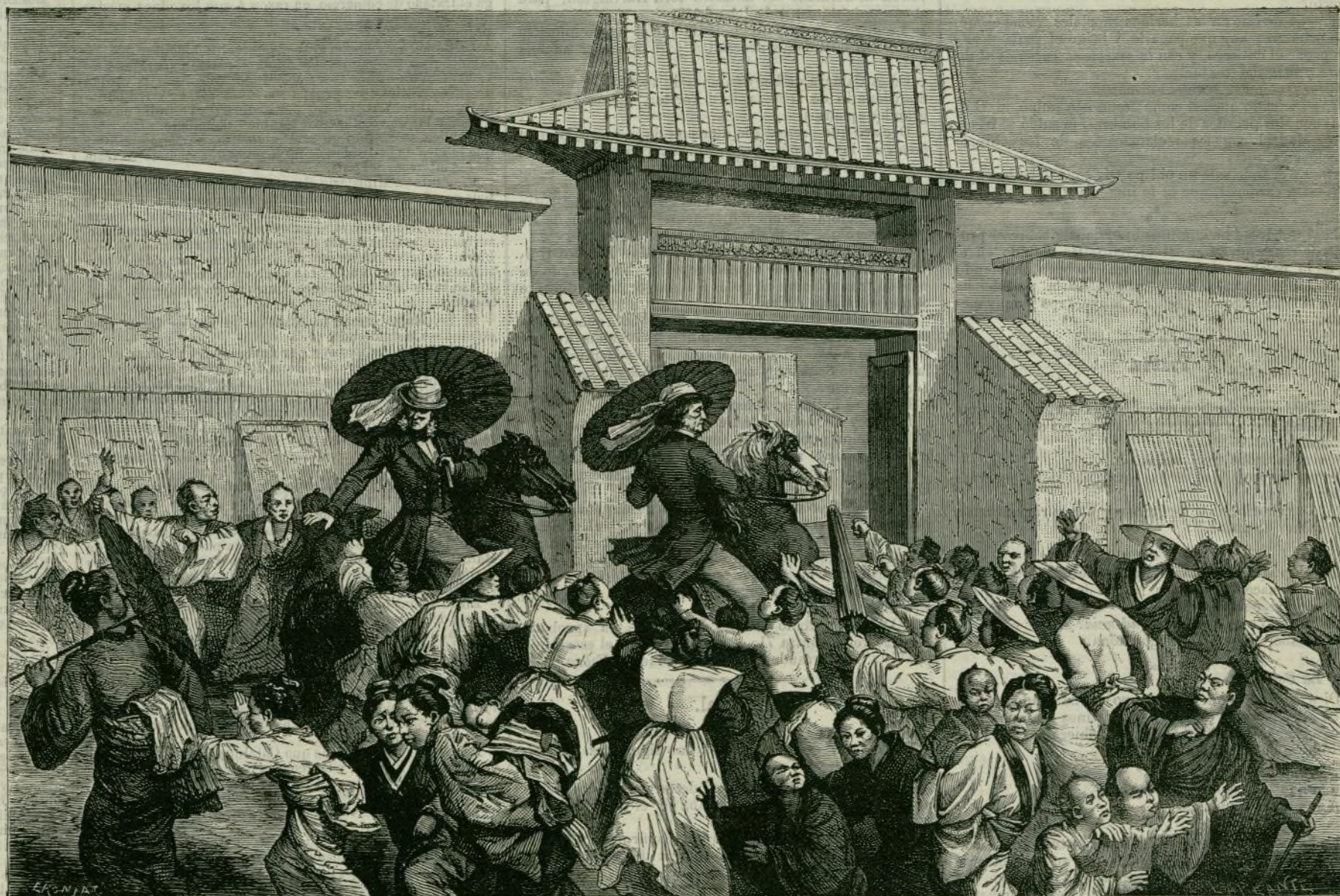
JAPON.—EUROPEOS PROFANANDO CON SU PRESENCIA EL PALACIO DEL MIKADO.

Crear después de esto que el sueño es debido á una presion de las venas distendidas, á una congestion venosa, es un absurdo.