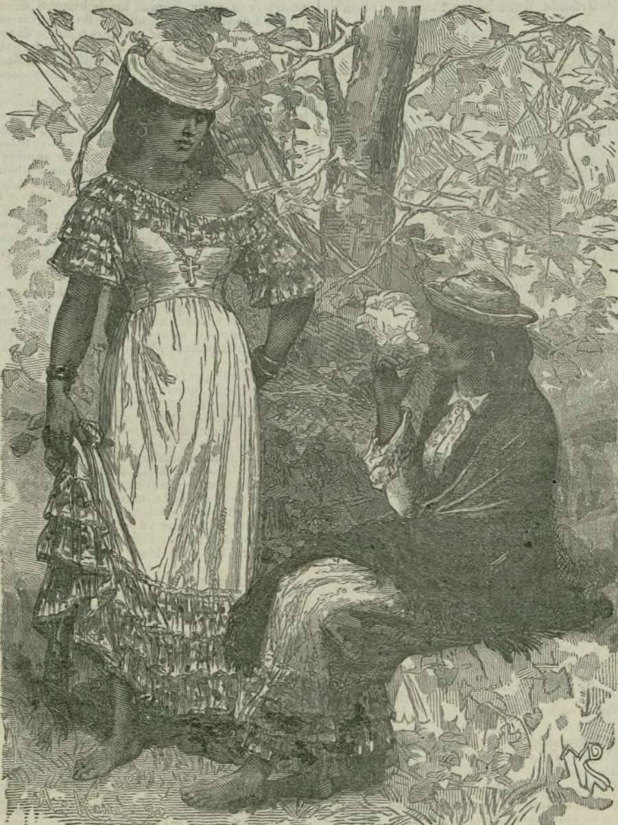
LAS MUJERES DARIENITAS.

Ensalzó, entre otras, como virtud del gato, su amor al hogar que le cobija, que por humilde y pobre que sea, le inspira tal afecto, que vuelve siempre á él, por lo cual es necesario, al trasladarlo, llevarlo en una cesta ó en un saco, para que pierda por completo la pista.