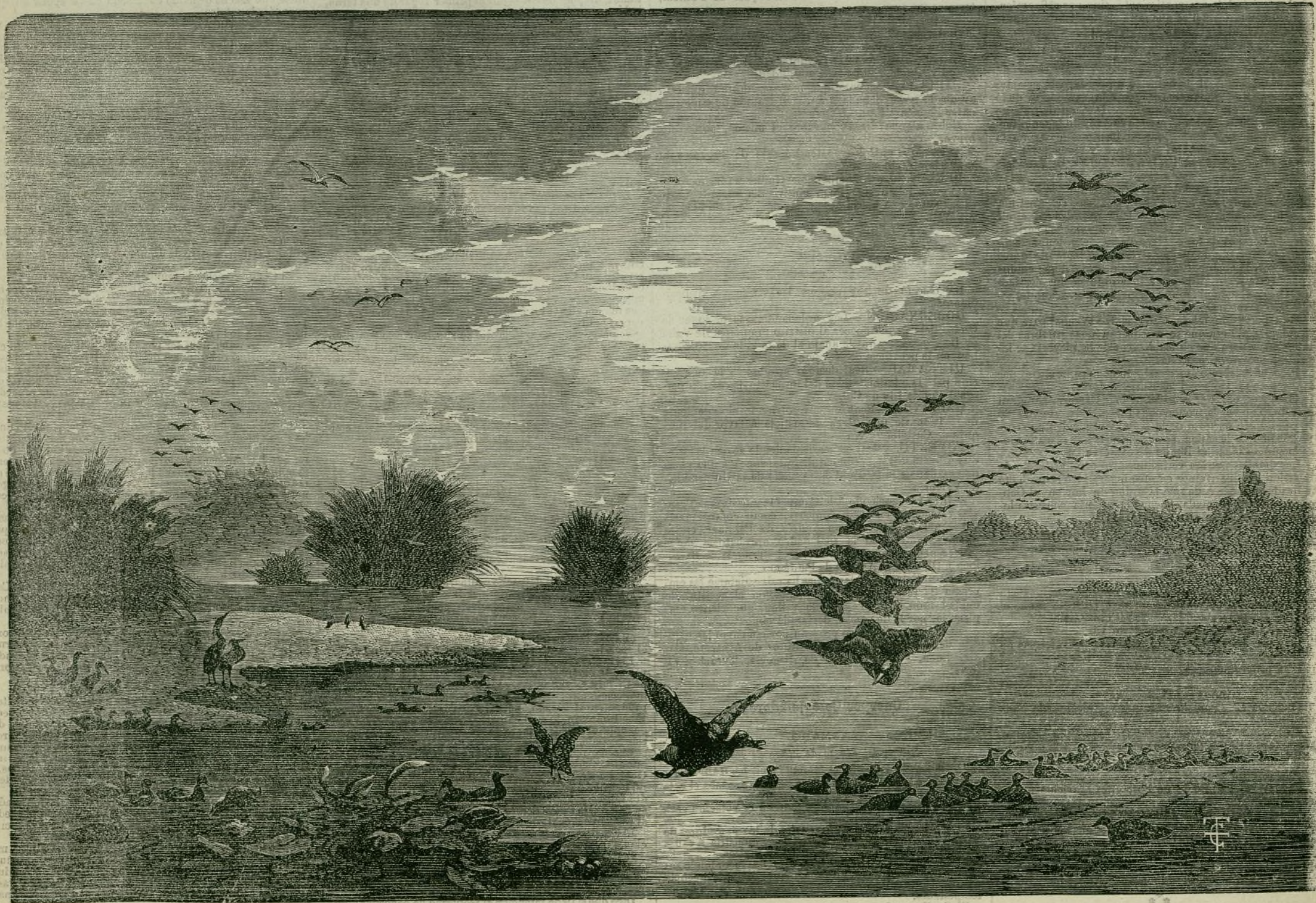
ORILLAS DEL TIATI.

La princesa no tiene intención de regresar á Rusia