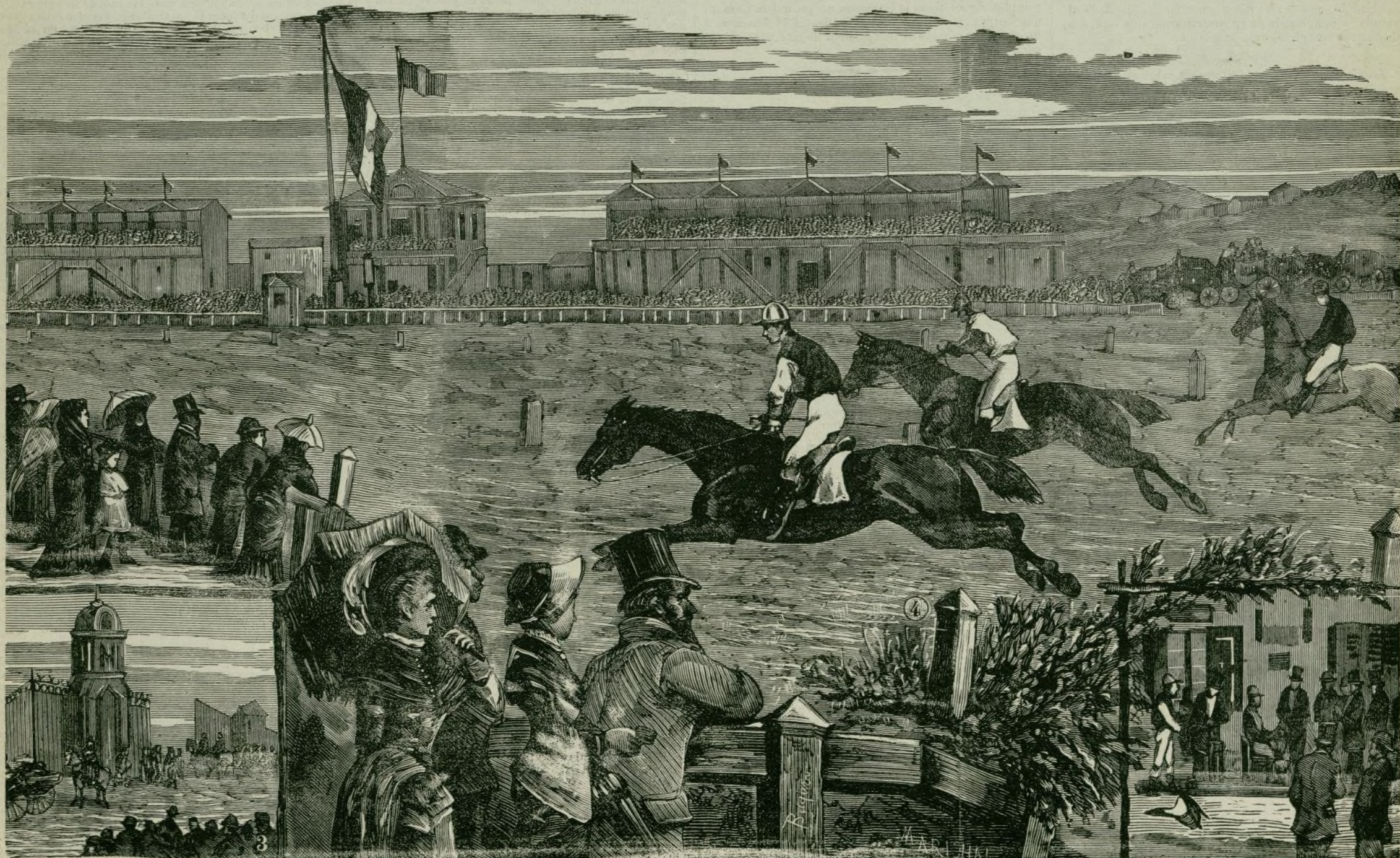
EL HIPÓDROMO DE LA CASTELLANA.

El duque de Fernan-Núñez ha demostrado de nuevo su exquisito gusto al dirigir el decorado del palacio de España, y en breve piensa inaugurarle con varias reuniones musicales y dramáticas, que se verificarán por la tarde.