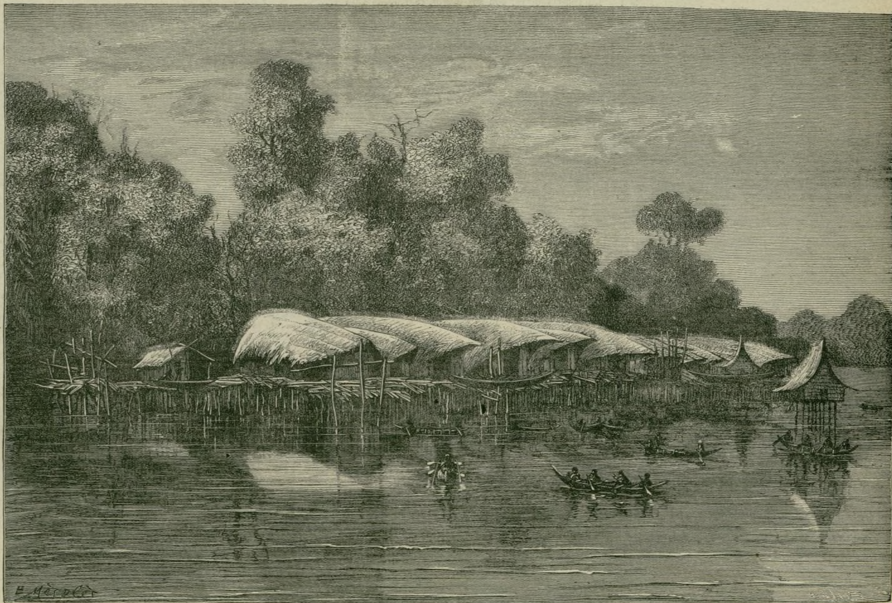
NUEVA GUINEA. — PUEBLO CONSTRUIDO SOBRE UN LAGO

En cuanto á nuestra personalidad humana y á su inmortalidad ó resurreccion, es necesario distinguir entre la materia y el espíritu.