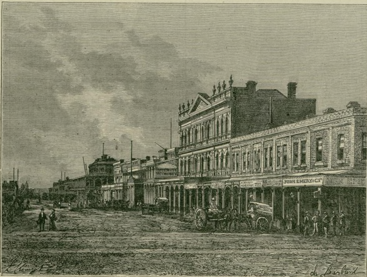
CALLE PRINCIPAL DE SANDHURST (AUSTRALIA).

Las experiencias hasta ahora llevadas á cabo, según el Diario de San Petersburgo , son la comparación de las mejores razas para estos servicios, dando los mejores resultados, después de muchas pruebas, los perros-lobos del Oural. Así, en uno de los reconocimientos ó estudios practica-