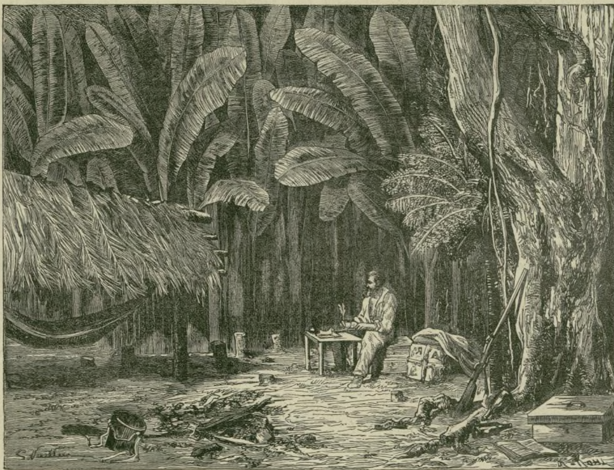
BOSQUE DE BANANOS EN EL ISTMO DE PANAMÁ.

Sin embargo, tuvo que ir á explicarse á la prevención