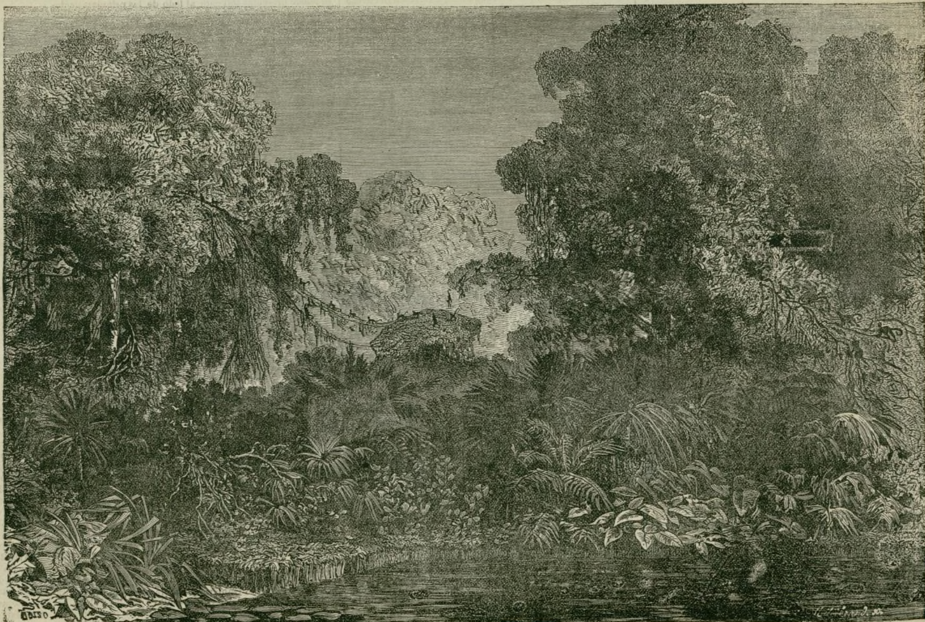
VISTA GENERAL DE SIDNEY (AUSTRALIA.)

El busto del ilustre finado, que resulta algo pequeño, parece que será sustituido por otro que esté en armonía con la grandiosidad del monumento, que ha costado unas 125.000 pesetas.