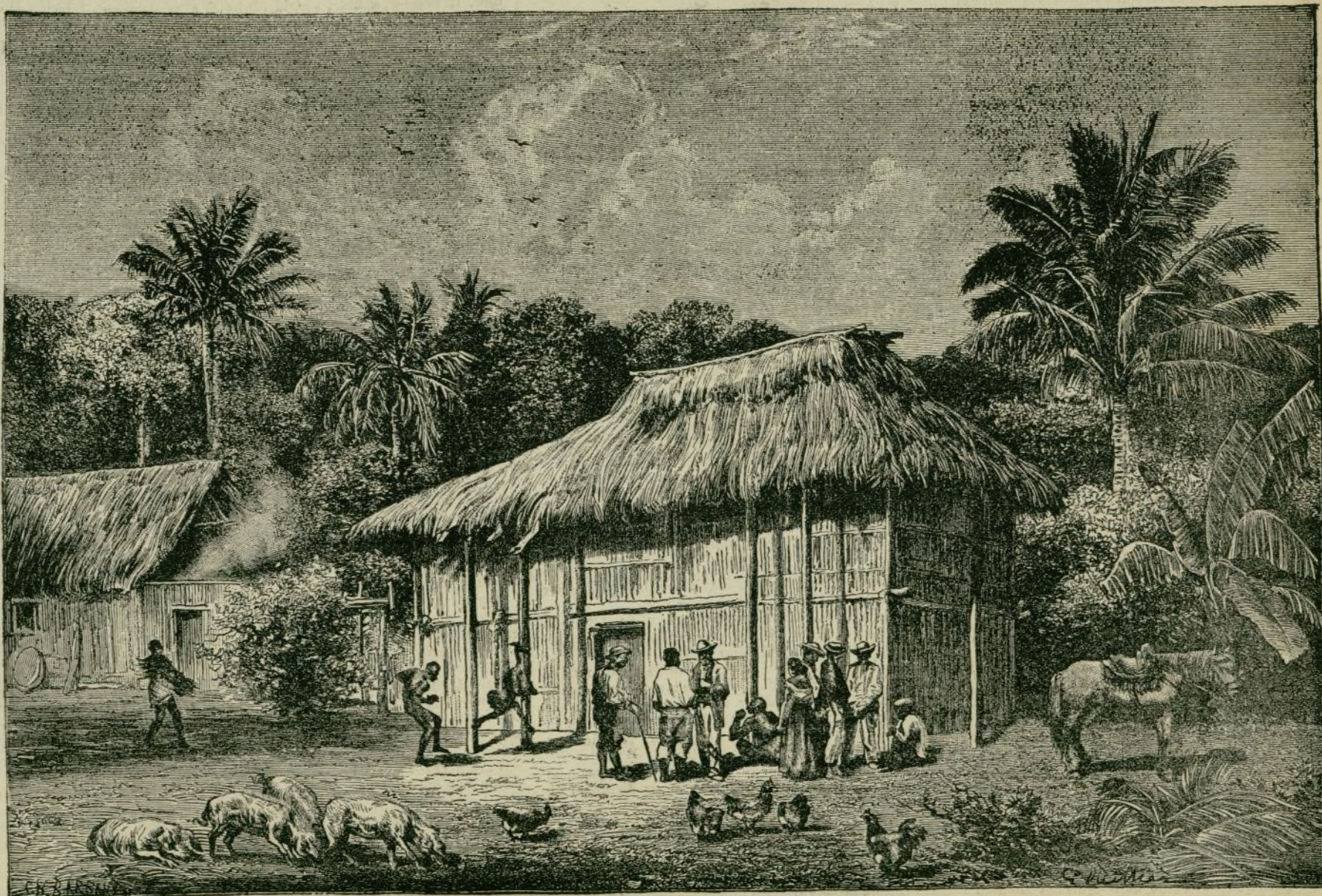
UNA CASA EN EL DARIEN

En Hamburgo se está construyendo sobre el glasis un edificio para hacer, si es posible, observaciones del fenómeno astronómico.