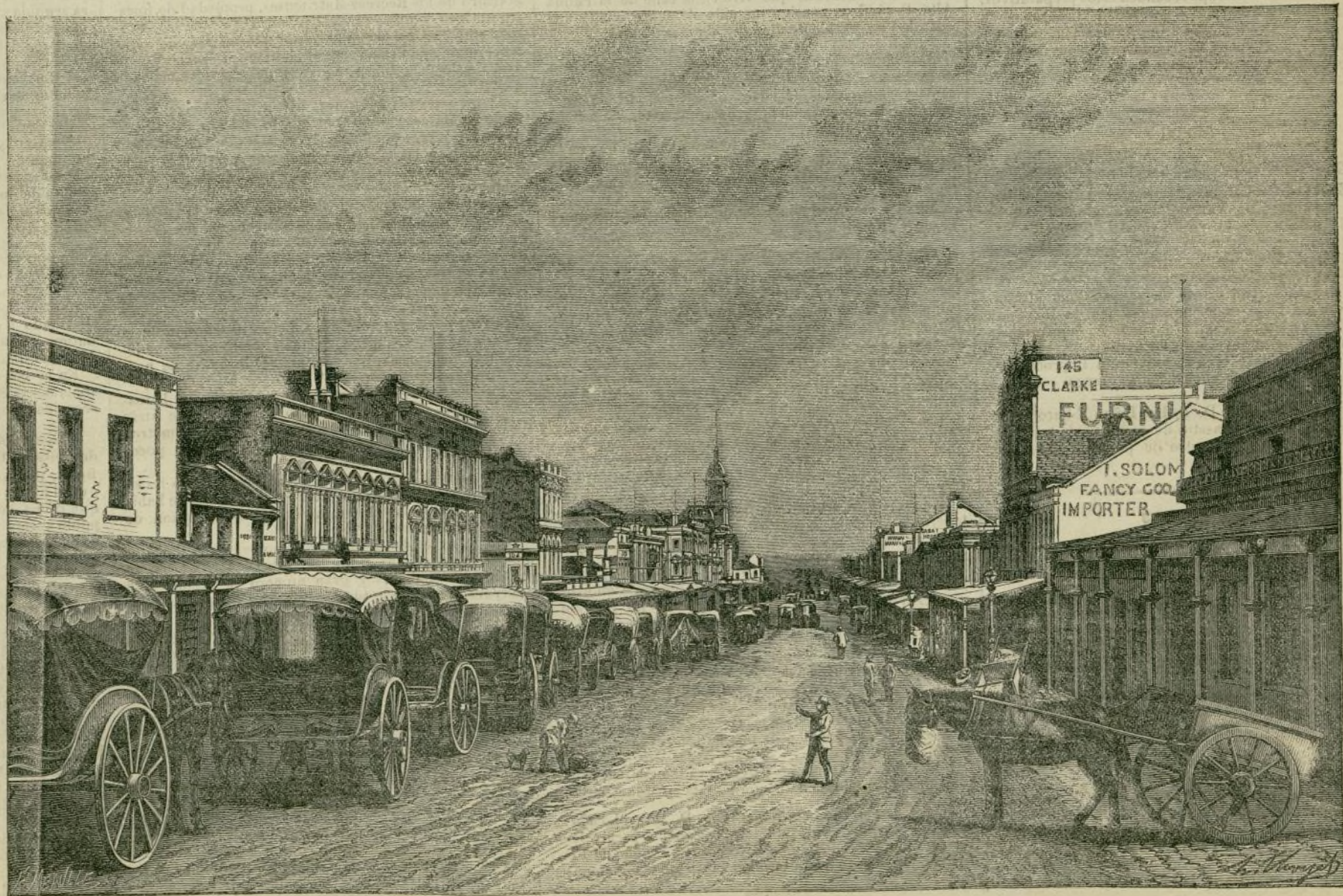
AUSTRALIA.—UNA CALLE EN MELBOURNE

Por una coincidencia curiosa, el doctor Kuapps, de Singapoore, ha detenido los efectos mortales del veneno de la serpiente administrando á los heridos, no el permanganato de potasa, sino el manganato de sosa, es decir, una sal cuya composición es la misma, con poca diferencia, que la precedente.