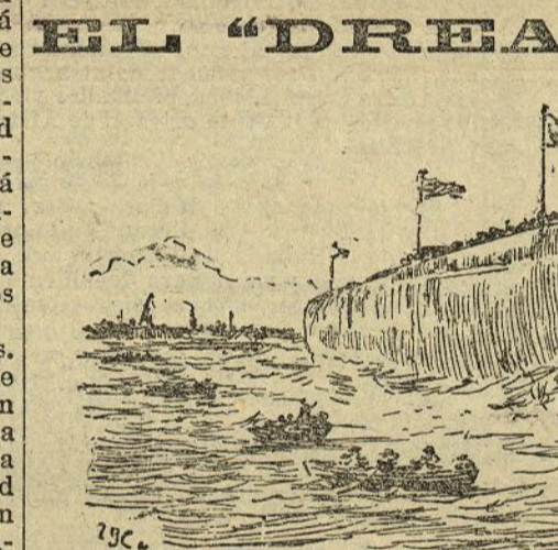
El acorazado-cruceiro inglés "Dreadnought" de 18.000 toneladas

El arte de construcciones navales ha hecho tales progresos en el transcurso de medio siglo a esta parte, que sería empresa más que temeraria intentar siquiera levantar el velo que oculta el porvenir en lo referente a esta materia.