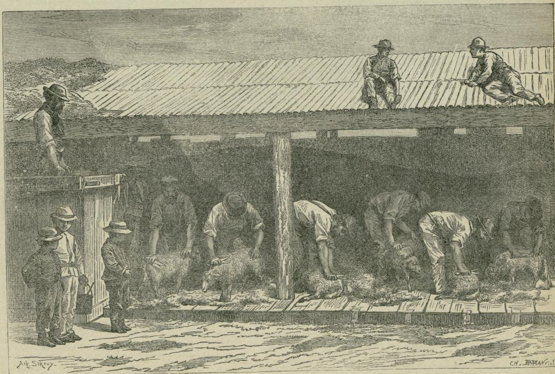
AUSTRALIA.—EL ESQUILEO EN UNA estacion