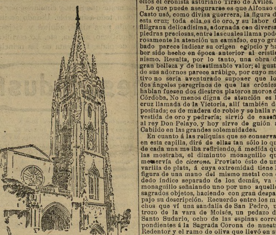
La catedral de Oviedo

Con el recuerdo de épocas pasadas, venían a mi memoria los nombres de tantos y tan ilustres personajes que tanta gloria dieron a su patria y no podía dejar de compararlos a los tres anteriores grandes oviedenses, actual pequeño, nuestros hombres de entonces con