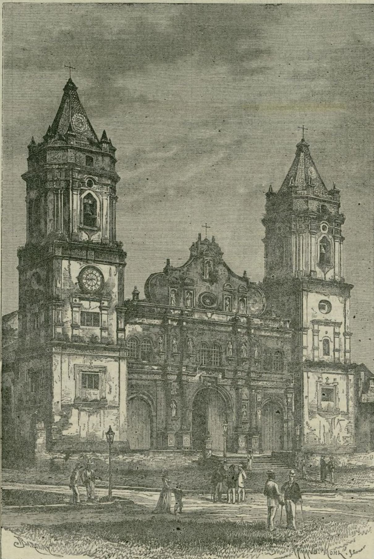
LA CATEDRAL DE PANAMÁ

conmemorativo del segundo centenario de la muerte de D. Pedro Calderón de la Barca, y consagrado á enaltecer la memoria del autor de La vida es sueño , bajo las siguientes bases: