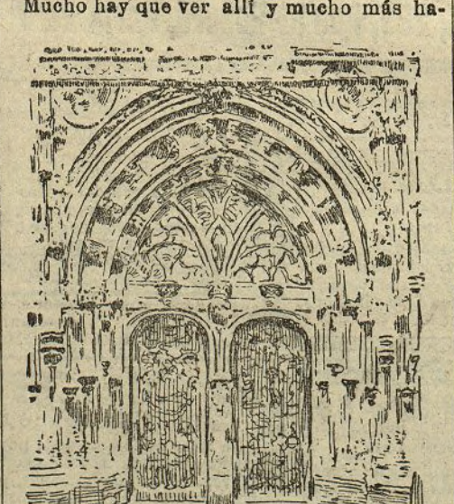
Puerta principal de la catedral

Sumido en estas tristes reflexiones caminaba yo por las calles de la población, cuando inopinadamente me hallé frente a la magnífica catedral, suntuoso edificio construido en el siglo XIV, enclavado en el mismo sitio en que estaba la primitiva catedral, fundada por Alfonso el Casto. Pertenece al género gótico, es de gran belleza y admirable la altura de su torre y la delicada construcción de sus arcos y trepados, ostentando en su cúspide la Cruz de los Angeles, blason de la catedral y de la ciudad. Consta en su interior de tres naves, adaptándose en su forma a la de una cruz latina, y tiene además varias capillas laterales, enriquecidas con multitud de ornatos delicadísimos.