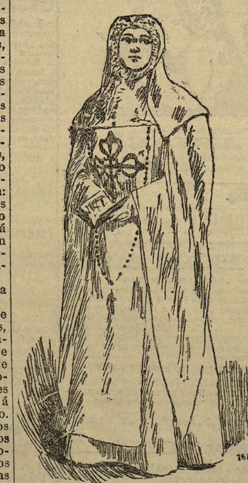
El notable transformista imitando a Doña Inés en el momento del "último envenenado".