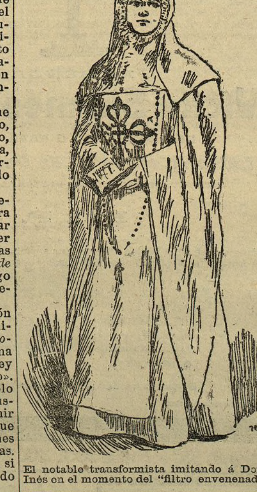
El notable transformista imitando á Doña Inés en el momento del «filtro envenenado»