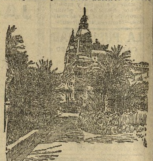
MONTECARLO.—La terraza del Casino

En el interesantísimo viaje a Roma organizado por el DIARIO UNIVERSAL y la importante Agencia Thos. Cook y Son , figura una detenida visita a Monte-Carlo, cuyos detalles pueden ver nuestros lectores