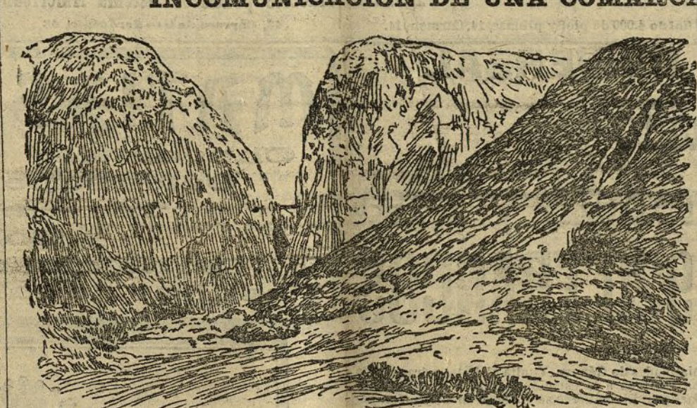
Cascada y desfiladero de El Chorro

En cambio, esos carreteros que van tras sus modestos carrozcos, ganándose la vida bajo el sol de estío, bajo la nieve del invierno, mal comidos, sin ropa que cubra sus carnes, para tras penosas jornadas ganar un jornal con que atender á las hambres de las familias, necesitan la garantía de su derecho al trabajo, y sobre todo, de su derecho á la vida.