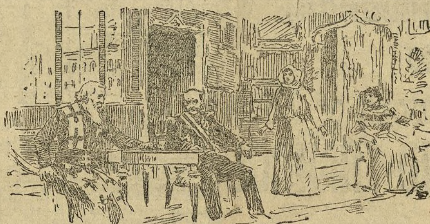
La conversión de Pawlona (escena del segundo acto).