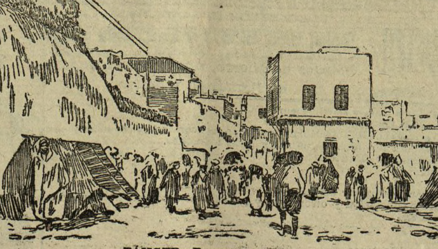
TÁNGER.—Puerta de la Ténoria

— París (23 t). Las tropas indígenas rebeldes de Taflete han atacado a una partida de meharistas, apesándola.