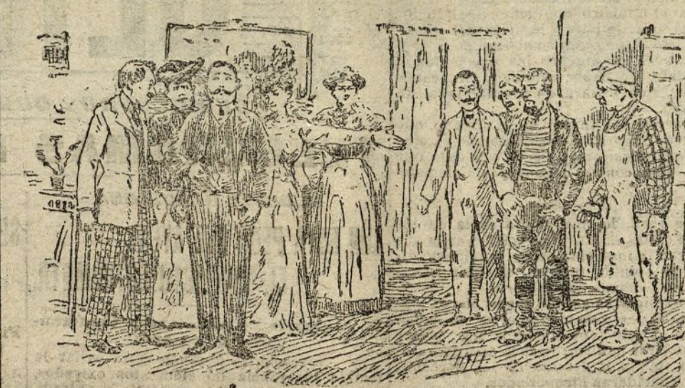
EN LA COMEDIA.—La gratificación al salvador de Carlota (Escena del acto tercero de Los Aborregos)

Dicha señora pronostica, entre otras cosas, que el Papa morirá de muerte violenta, que habrá una guerra naval en la que Alemania obtendrá grandes victorias, y que Berlín se hará famosa como sanatorio de tsaicos, gracias a las propiedades de una fuente que se alumbra en el Jardín Zoológico.—Hahn.