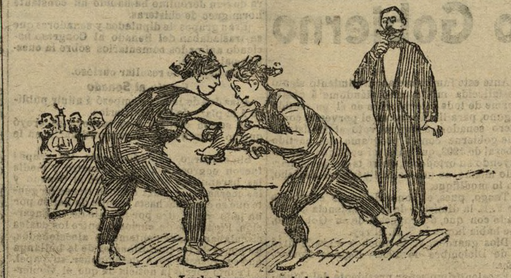
Luchadoras rusa y holandesa