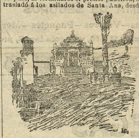
El pabellón de Nuestra Señora del Carmen, destinado a ancianos

Empezaron las obras de construcción de este Asilo el 16 de Febrero de 1894, y poco después, al terminarse el primer pabellón, se trasladó a los asilados de Santa Ana, desde