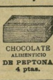
CHOCOLATE ALIMENTICIO DE PEPTONA 4 ptas.

Se vende inmediatamente al por mayor y al por menor en todas las principales farmacias de España y Ultramar.