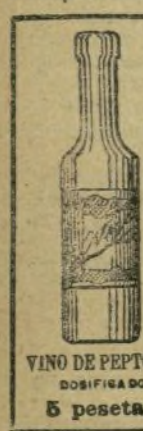
VINO DE PEPTONA 5 pesetas.

DEPÓSITO GENERAL en España: Farmacia y Laboratorio químico de ORTEGA, Leon, 13, MADRID.