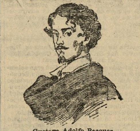
Gustavo Adolfo Becquer

Manifestación grandiosa. La lápida. —Soria 23 (3 t.).—El homenaje a los hermanos Becquer ha resultado grandioso, contribuyendo a ello la esplendidez del día. Organizase la manifestación en el Ayuntamiento, presidida por el alcalde y Miguel de