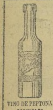
VINO DE PEPTONA dosificado 5 pesetas.

Preparado con vino generoso de España, da tonicidad al estómago, es altamente nutritivo y facilita la digestión. Es tan agradable como el mejor de postre.