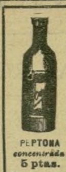
PEPTONA concentrada 5 ptas.

Primera y única fabricación en España de las PEPTONAS y sus preparados: Farmacia y Laboratorio de ORTEGA, Leon, 13, MADRID.