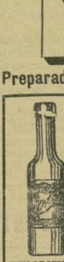
VINO DE PEPTONA 5 pesetas.

Primera y única fabricación en España de las PEPTONAS y sus preparados: Farmacia y Laboratorio de ORTEGA, Leon, 13, MADRID.