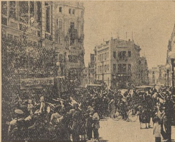
CASTELLON.—Tras las últimas batallas entra "Auxilio Social" a las poblaciones liberadas a secar lágrimas, cubrir necesidades y sembrar optimismos.

La fiesta, como todo lo que organiza y lleva a cabo la benemérita institución, alcanzó magníficos contornos y constituyó un exponente más de las numerosas simpatías que nuestra Causa cuenta en los distintos círculos sociales de la capital, observándose la