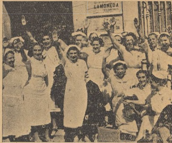
CASTELLON.—Grupo de muchachas de "Auxilio Social" saludan brazo en alto, algunas, luciendo condecoraciones que cantan abnegación, sacrificios y entusiasmos.

Esto ocurrió ha siete siglos, cuando los judíos andaban por España a sus an-