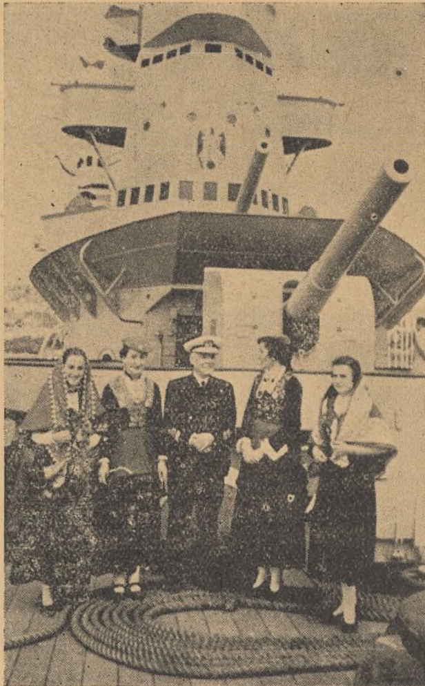
FERROL.—El Almirante Cervera con la Comisión de Damas que asistieron a la botadura del crucero Navarra.

En un arrabal de Sevilla se presentó una banda de esos hombres sin Dios ni patria que ganaban la vida dando sesiones de juegos de manos, circo y prestidigitación, embaucando a las gen-