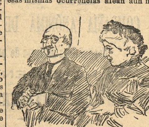
La marquésa de los Arrayanes y su administrador