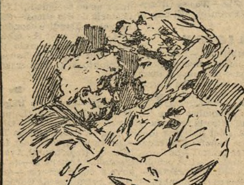
Consolación y chacha Pepa

Los Sres. Thous y Cerdá, con el maestro Pepe Serrano, se equivocaron completa y lamentablemente. Los libretistas no han acertado a desarrollar lo que les sirvió de idea fundamental, y el músico no ha tenido la fortuna de mostrarse esta vez a la altura de su bien ganada reputación.