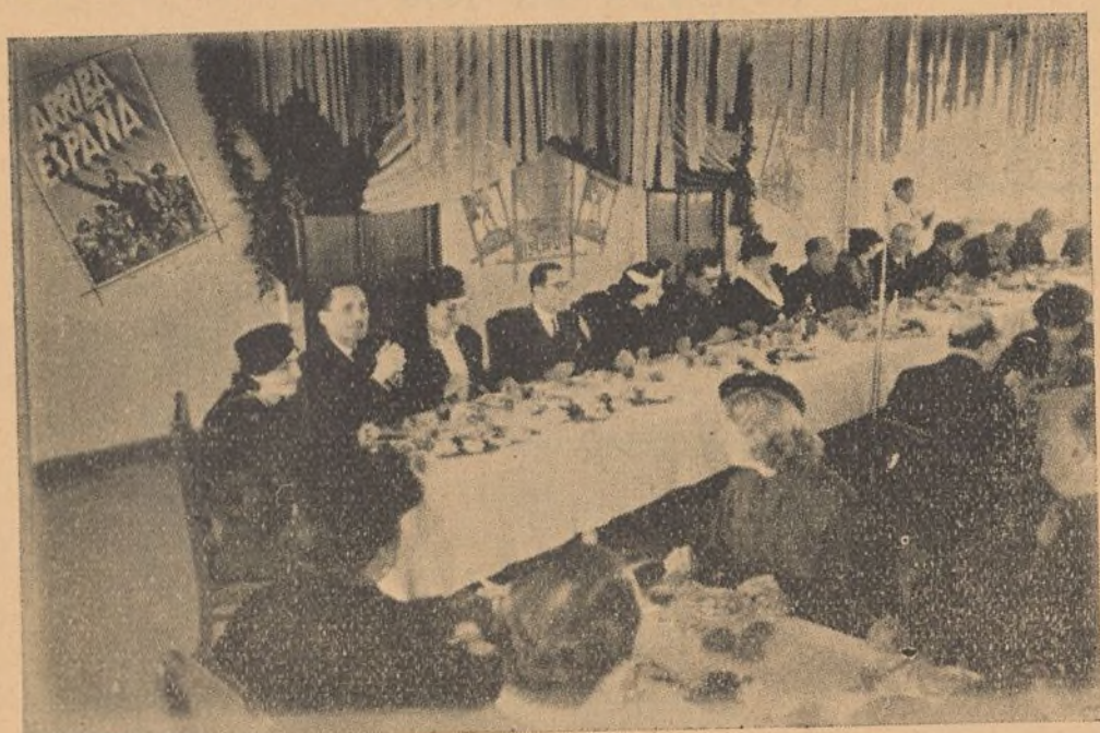
La Mesa de Honor, presidida por el representante del Generalísimo Franco.

Y así llegó aquel 29 de octubre, y con él la guardia a la intemperie, bajo