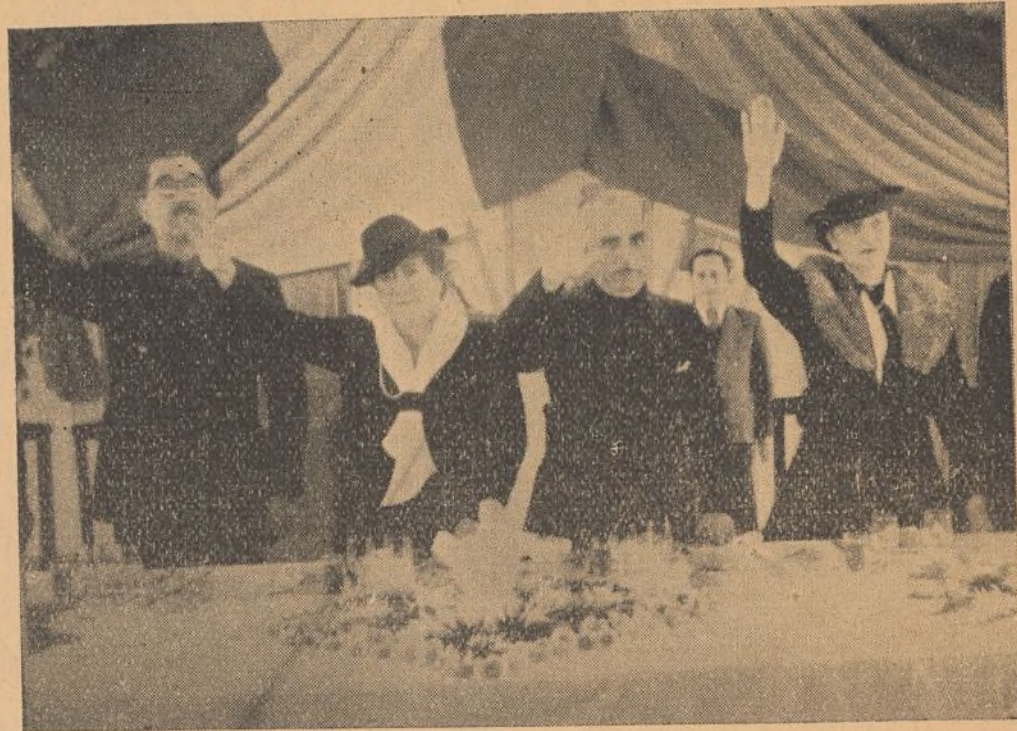
Puesto en pie, brazo en alto, la presidencia de la mesa, escucha con respetuoso recogimiento las vibrantes notas del Himno Nacional del Perú.

sustancial con el régimen mismo, por decisión del Caudillo, intérprete del pensamiento del Ejército y del pueblo, que combaten y mueren por algo más serio y más profundo que las ambiciones ruines y egoístas de este grupito o de aquel corrillo. Por eso, porque la Falange no es un partido más; que partido es eso, porción y pedazo, y la Falange por ser un todo entero ha de tener horizontes amplios que atraigan a las masas sanas de derechas y de izquierdas, hemos de darle toda la anchura y dimensión nacional que le corresponde, para que, con paso seguro, llegue el día en que ni uno de los hombres dignos deje de estar bajo los pliegues de nuestras banderas, de las flechas y el yugo, donde a todos los esperamos con una cruz de brazos abiertos. ( Fuertes aplausos, y voces de ¡esa es la Falange! ).