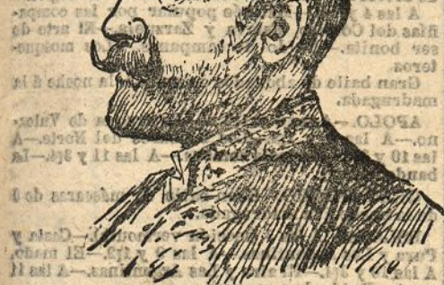
D. Manuel Aldeanosa ministro de Estado

Puntualmente han acudido los ministros á la Presidencia para celebrar el Consejo á que