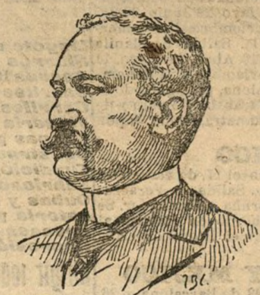
D. Francisco Javier Ugarte nuevo fiscal del Tribunal Supremo

Los señores tenientes de alcalde y los concejales están todos bien de salud. Tenemos el gusto de comunicarlo al público. No extrañe éste ni comente las relevantes muestras de pereza que vienen dando en la persecución del fraude que todos los días y a todas las horas cometen los tahoneros, ni la ninguna actividad que emplean en que se cumplan las Ordenanzas municipales; como les obsesiona encontrar el modo de realizar el bien público, no tienen tiempo para nada.