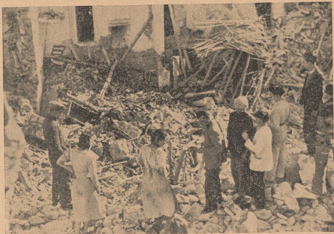
Este grupo de vecinos obreros ven sus hogares deshechos por las bombas arrojadas por aquéllos que los llamaban hermanos proletarios en mítines y comicios electorales..

de ferrocarriles y de carreteras, puentes marítimos en los cuales se descargan todos los elementos bélicos que les llegan abundantemente de Rusia, de