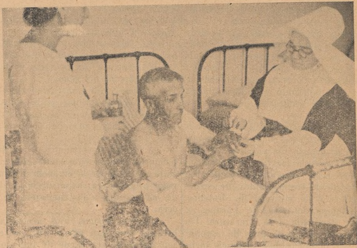
Una Hermana de la Caridad, que tal vez escapó de ser asesinada por los bárbaros, prodiga los cuidados cristianos a un anciano de 70 años, herido por la metralla roja, cuando corría asustado por las afueras de Cabra.

tencia en la alevosía—es una vileza inculcable que sólo logra hallar precedente en el propio hábito del marxis-