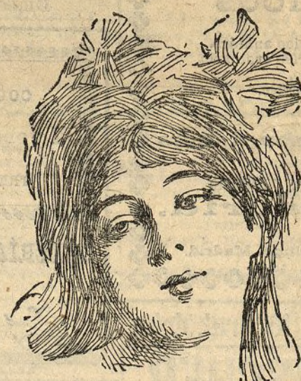
Mrs. Evelyn Nesbit

Cuando regresaron a Nueva York, Florencia encontró a White. A los pocos días éste la