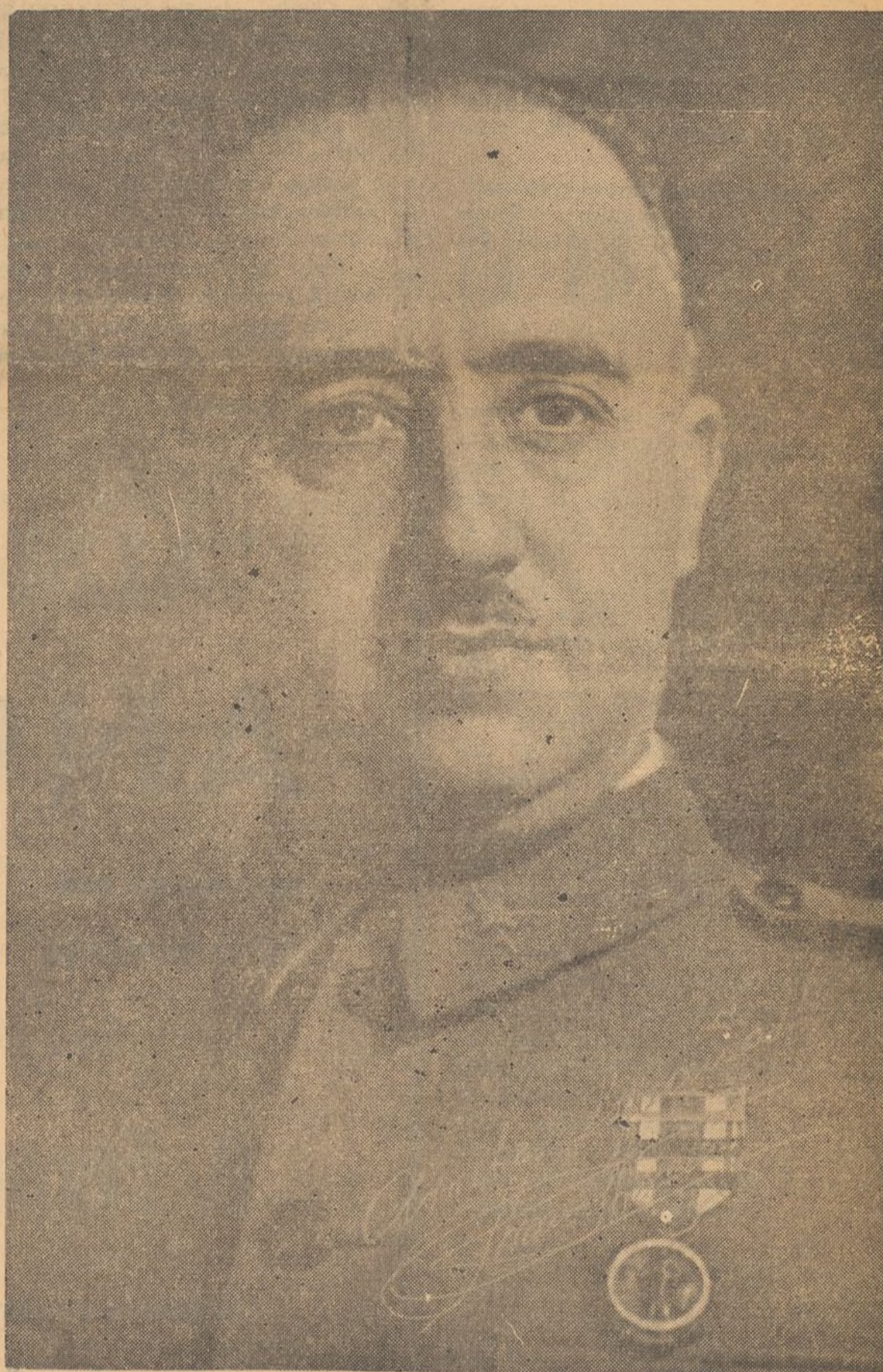
Bajo el signo del Caudillo, Jefe nacional de Falange Española Tradicionalista y de las J. O. N. S. se celebra la fiesta de exaltación del trabajo, el dieciocho de julio, aniversario del glorioso alzamiento

pongan la paz y la justicia. Huelgas revolucionarias de todo orden paralizan la vida de toda la población, arruinando y destruyendo sus fuentes de riqueza y creando una situación de hambre que lanzará a la desesperación a los hombres trabajadores. Los mo-