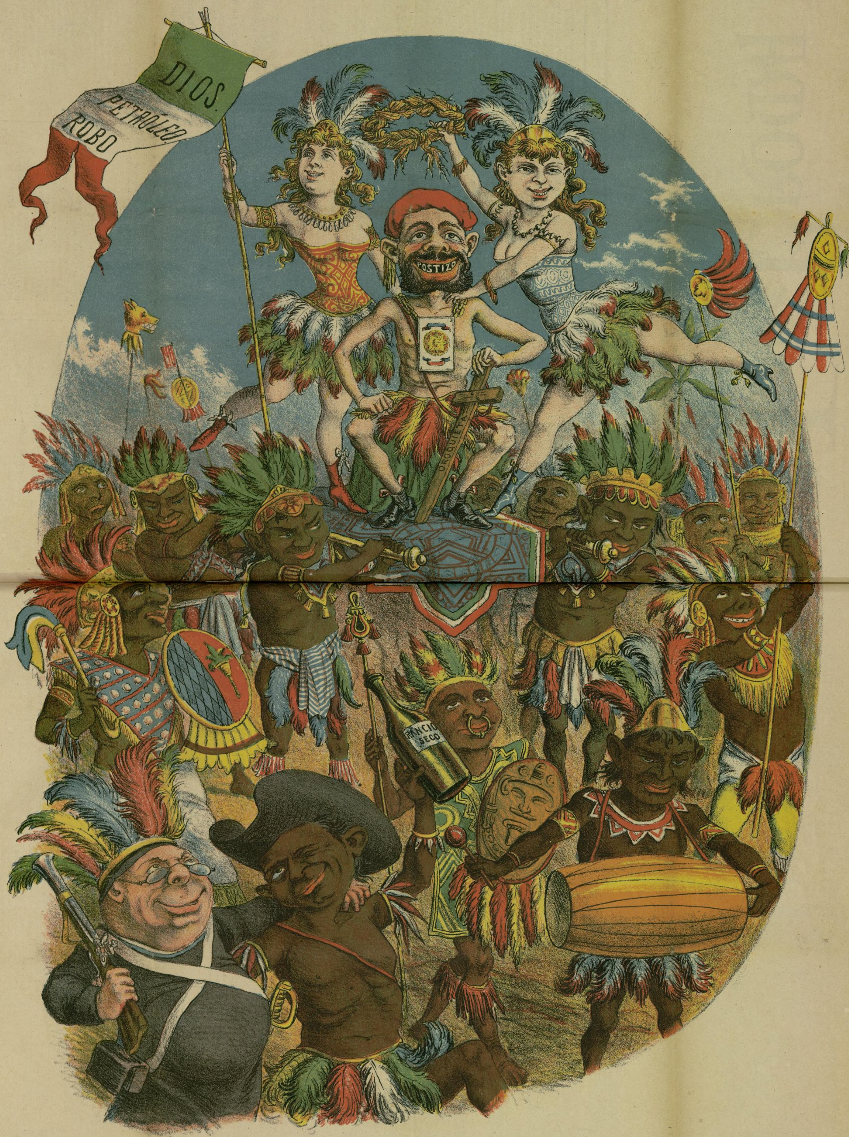
Coronación solemne en Zacatecas, de D. o Carlos el rey de los habiecas.