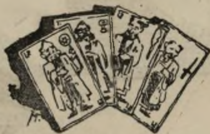
La baraja fusionista.