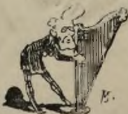
Allá va la nave, ¿quién sabe do va?