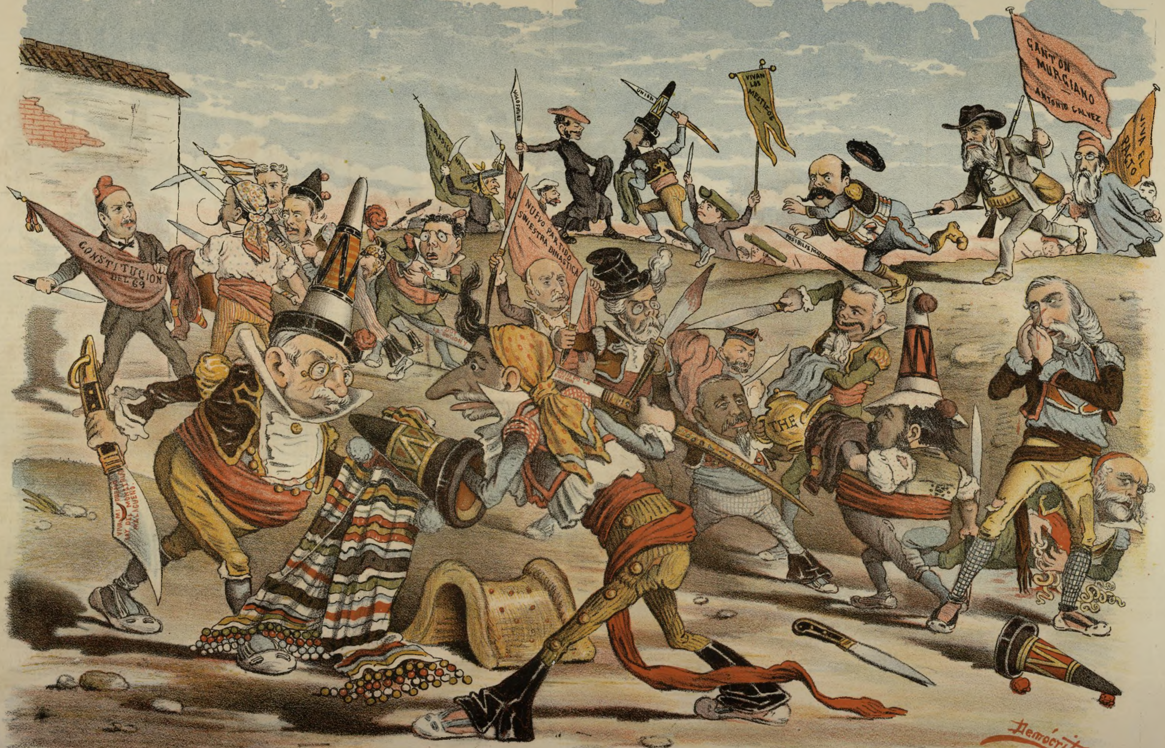
Politica Interior Ayuntamiento de Madrid

Demócrito LIT. J. ESPINOSA, SUCESOR DE BORRUAL, FENOL & CAÑAS