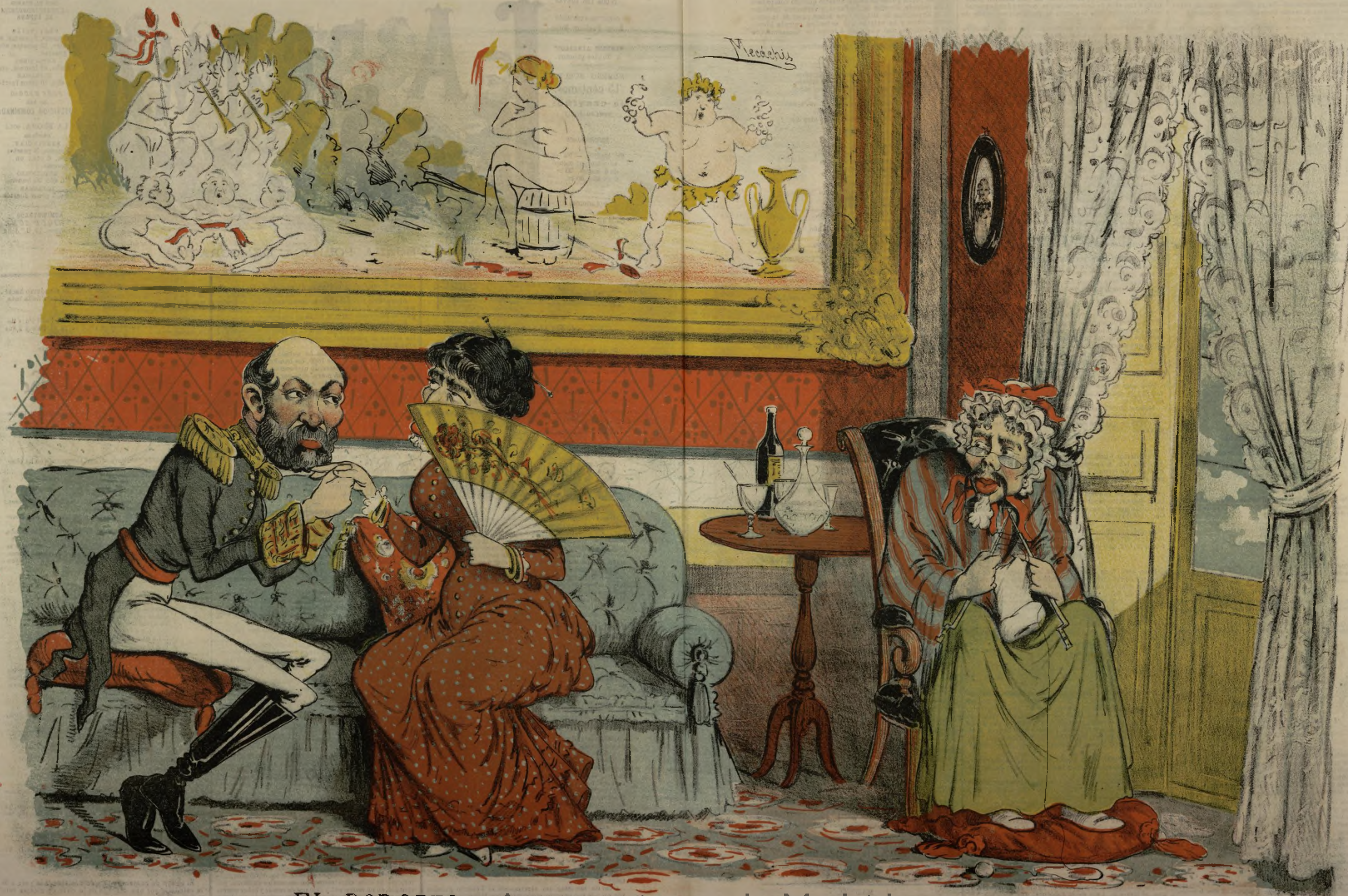
EL BODORRIO- Ayuntamiento de Madrid