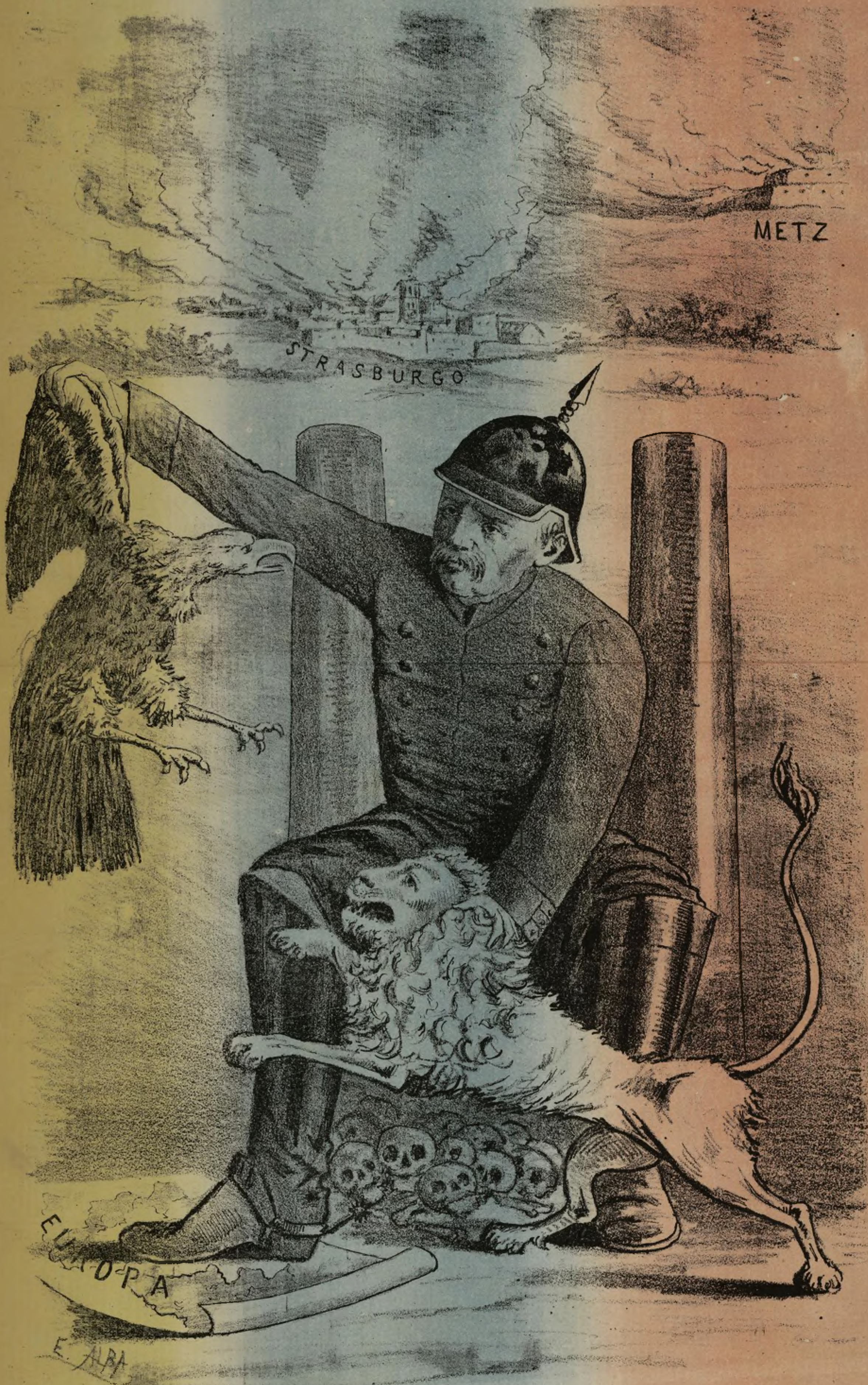
EL COLOSO SE DIVIERTE