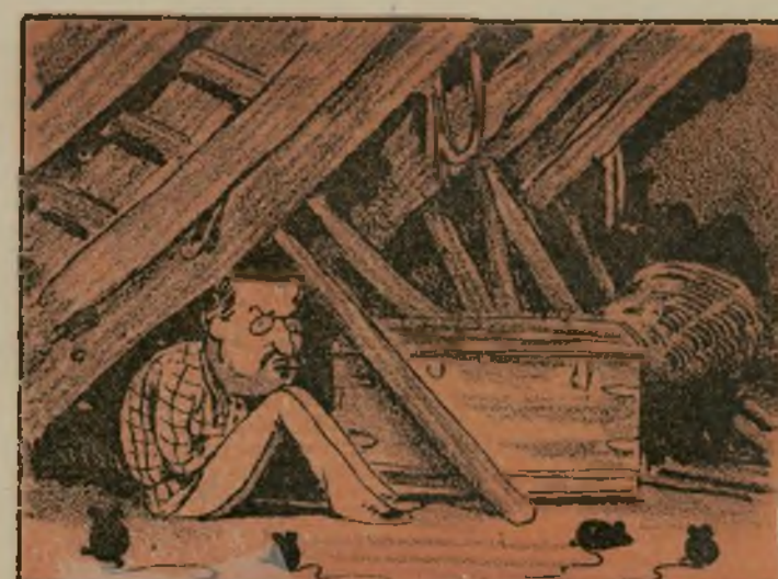
Vino la revolución y le metió en un rincón.