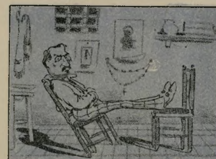
Sin estudiar halló modo de hacer que lo sabe todo.