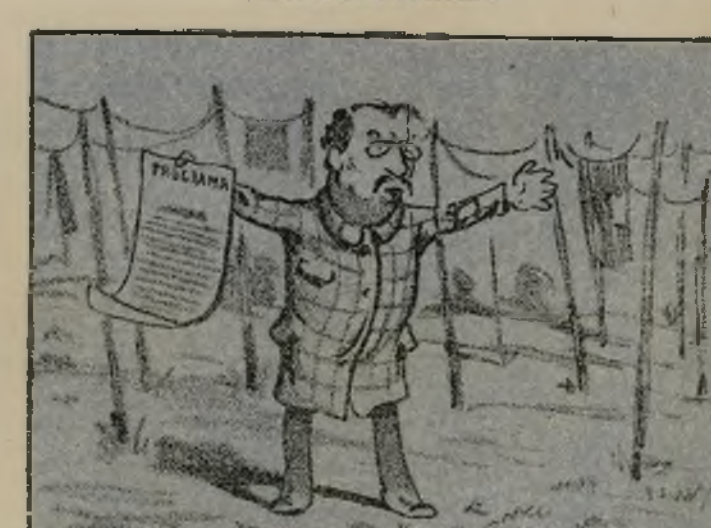
Con esa dote singularr dó al fondo del Montanar.