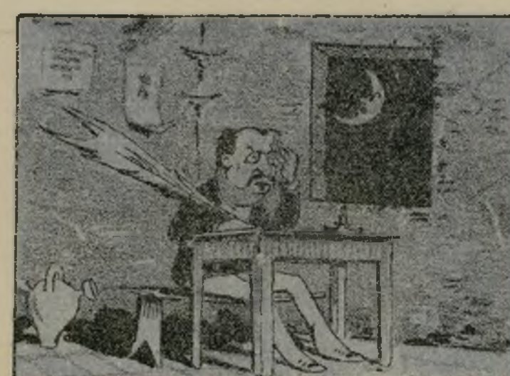
* Allí escribió sus fortunas los amores de la luz.