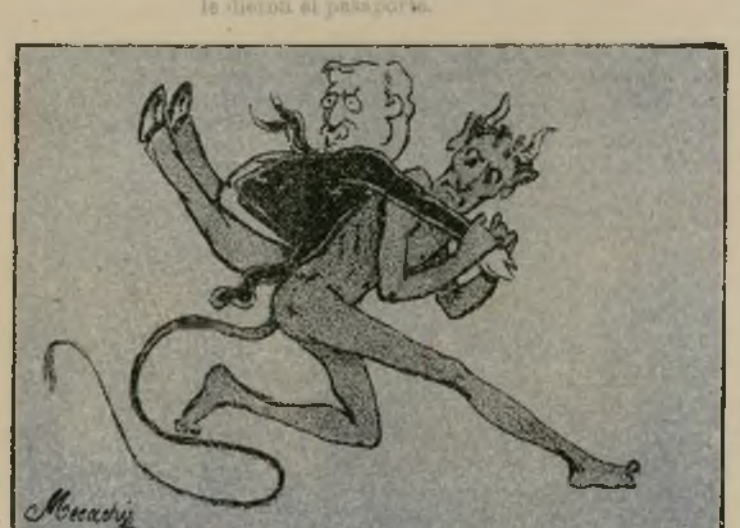
Hasta que venga el demonio y se lleve a D. Antonio.

Retrato y biografía del monstruo de Andalucía.