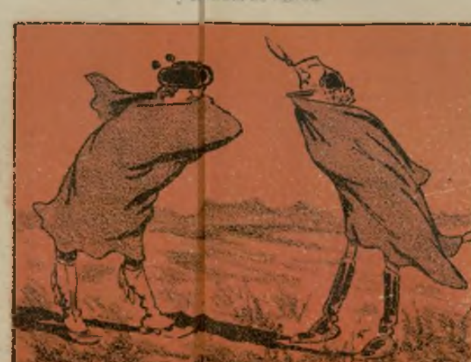
Le dio la indignación de su querido y la fiera.