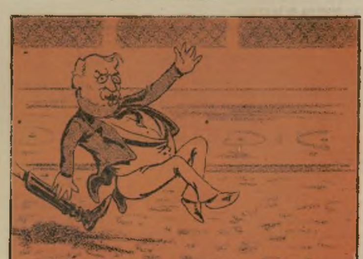
Para a pensar de su patria le dieron el pasaporte.