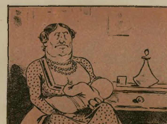
Y por mirar tanto al pecho quedó visco del derecho.