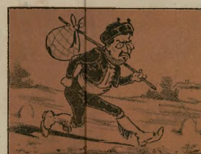
Vio a Madrid y paró con ganas de meorar.