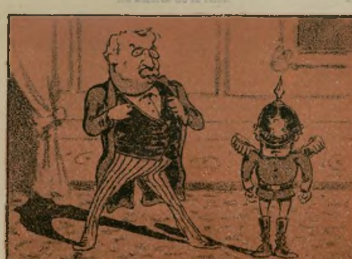
Pues todo como una rata ni Bismark le echa la pata.