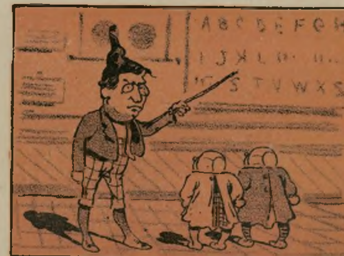
Le salió la primera mueca siendo maestro de escuela.