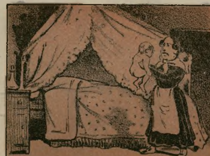
Nació, y vivió la luz del día, en la bella Andalucía.