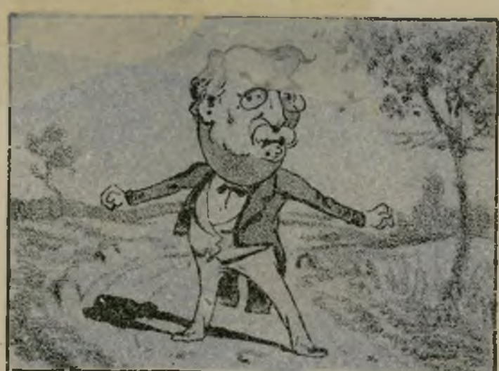
Ante lo cual soltó un toro y corrió contra el gobierno.