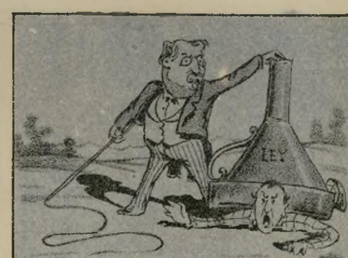
Y para sacar airo sus puso la ley de imprenta.