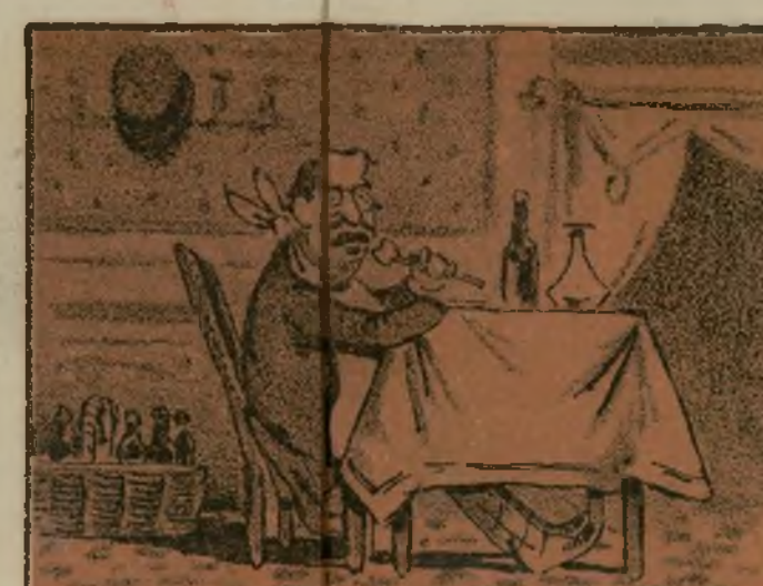
Se la restauración y entró de nuevo.