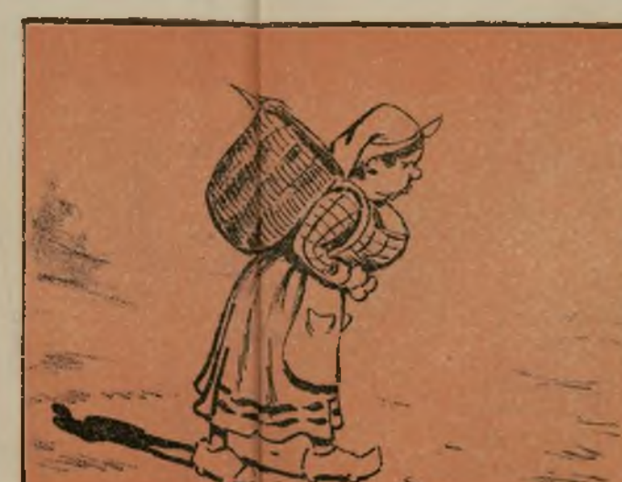
Le mandaron a errar para enseñarle a chupar.