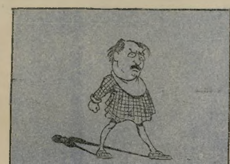
Fue el primo de todo el mundo por su penoso raciocinio.