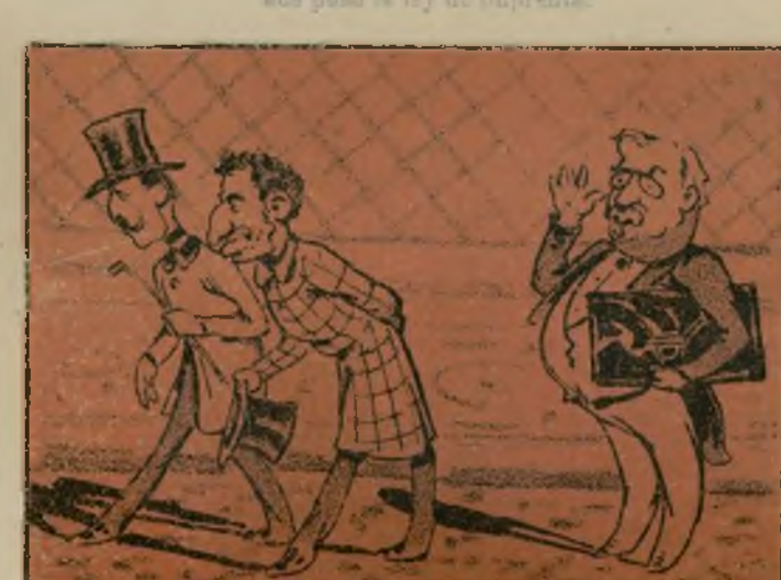
Y dándole el gran pago logró de nuevo dar juego.