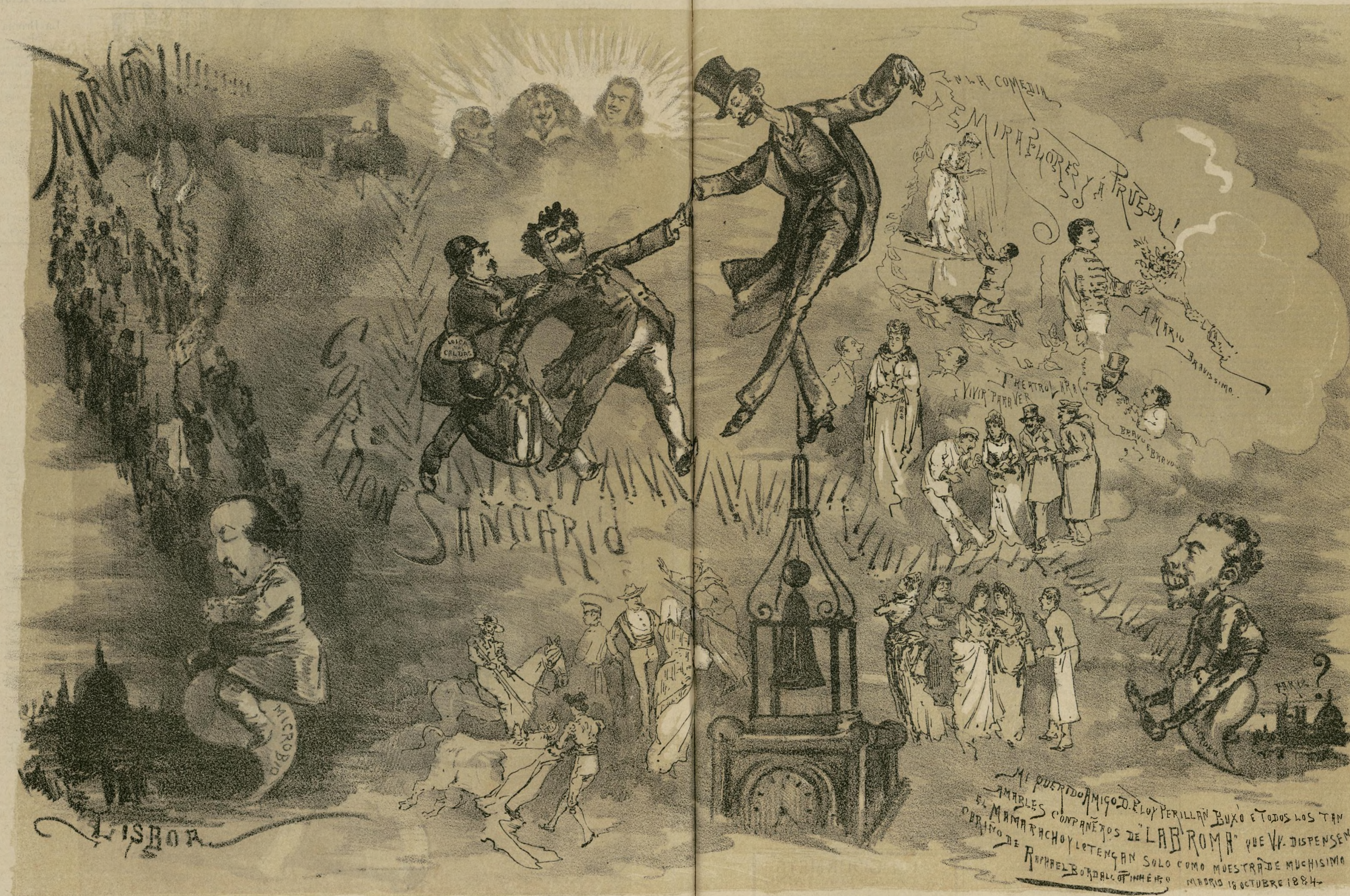
APUNTES DE UN VIAJERO. (VEASE LA EXPLICACION.) Ayuntamiento de Madrid