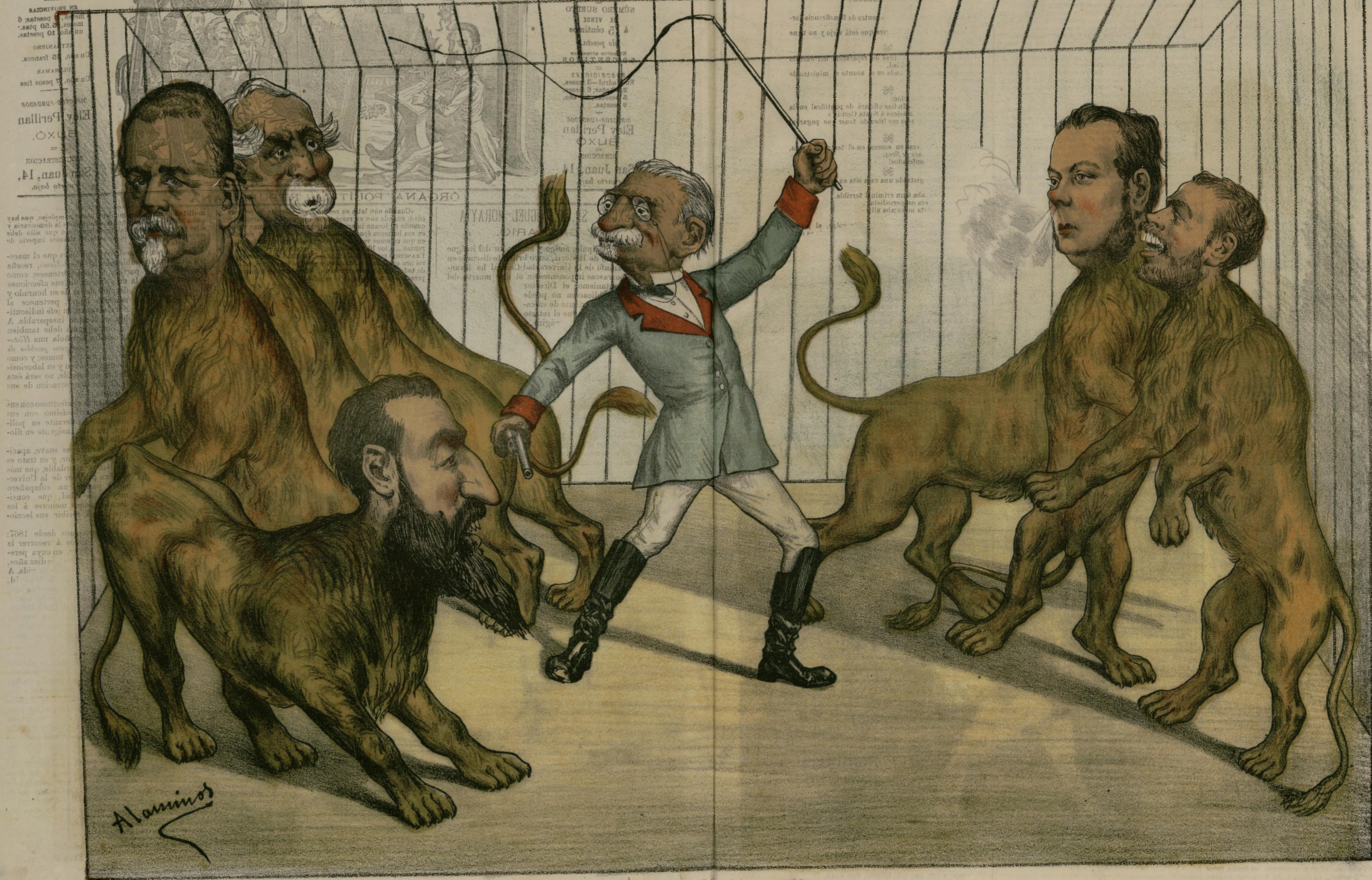
LA JAULA DE LOS LEONES. Ayuntamiento de Madrid