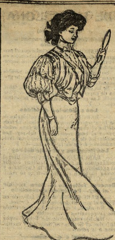
Las Pildoras Pink se hallan de venta en todas las farmacias al precio de 4 pesetas la caja o 21 pesetas las 6 cajas.

COMICO.—Pasado mañana domingo se pondrá en escena en este teatro, en las